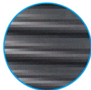
Stabil & belastbar durch massive Rippen