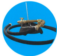
Tausch- und umrüstbare Einbauten