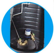
Intuitive Bedienung durch selbstlegende und beidseitig drehgelagerte Silikonschläuche