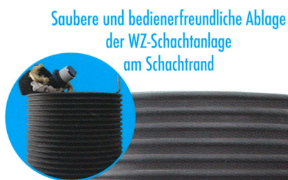
Saubere und bedienerfreundliche Ablage der WZ-Schachanlage am Schachtrand