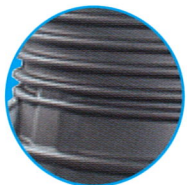
Einfaches Handling durch stabile Handgriffe